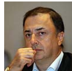
לב לבייב